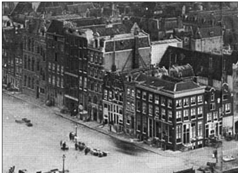
Hoekwoning van de familie en de firma Van Raap aan de Zwanenburgwal en de Houtgracht